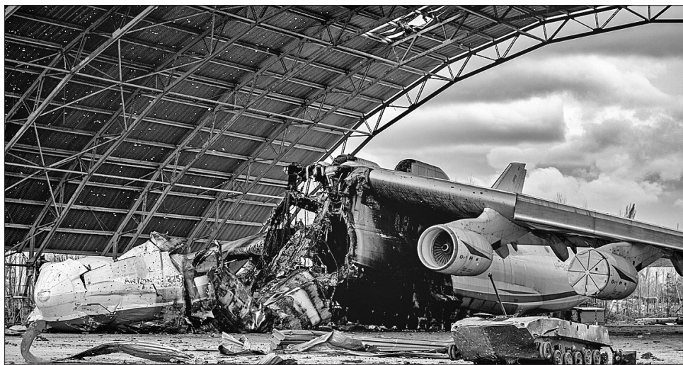
...а 24 лютого 2022 року його знищили російські варвари

Корольов — у космонавтиці. Наприкінці 1980-х їхні учні — продовжувачі справи двох талановитих людей чудовим чином зустрілися у спільному проекті. Космічний корабель багаторазового використан-