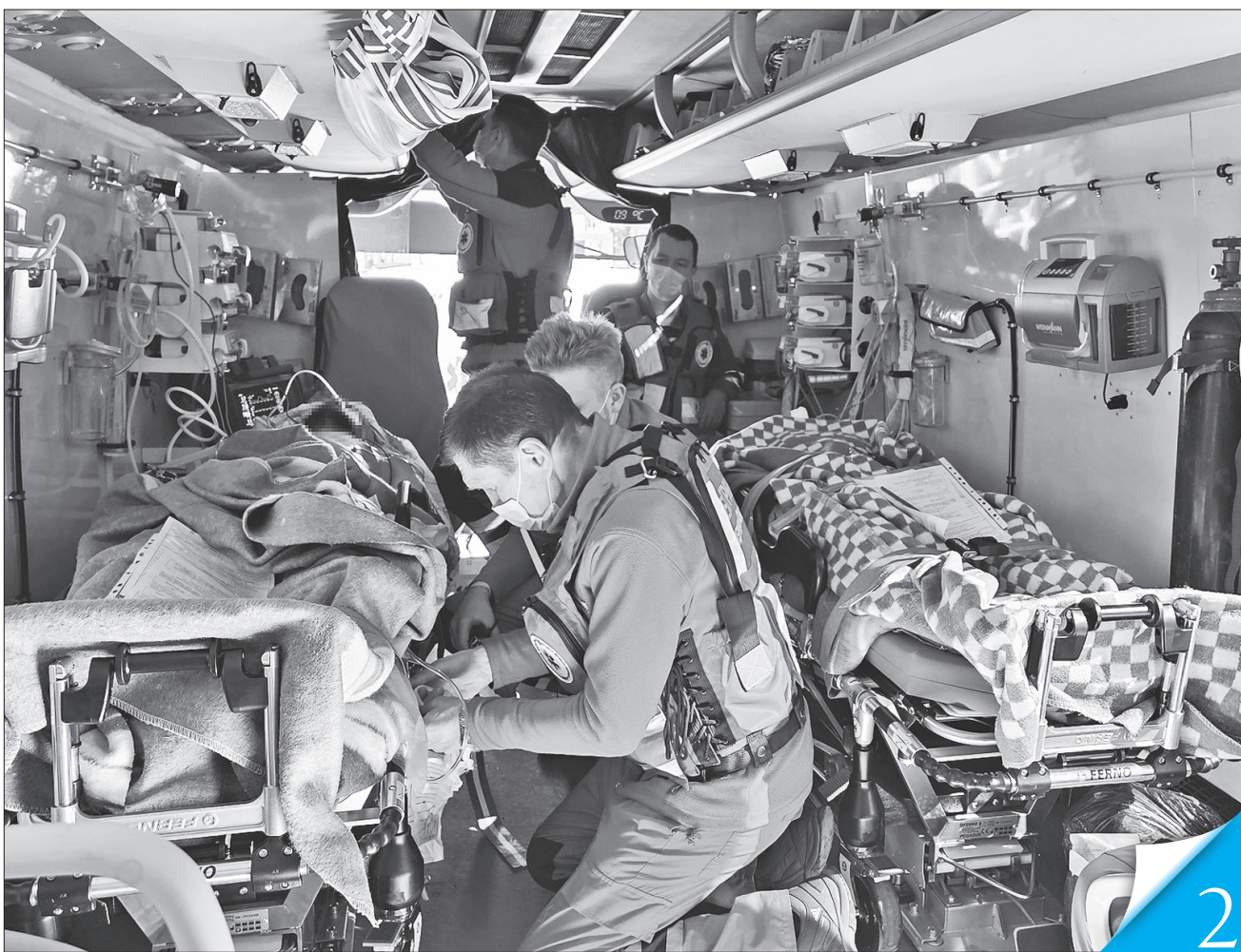
Медики готуються до чергового рейду на реанімобілі

НА ПЕРЕДНЬОМУ КРАЇ. Працюючи в надскладних умовах, екстрена медична допомога стоїть на варті здоров'я і життя українців