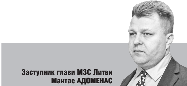
Заступник глави МЗС Литви Мантас АДОМЕНАС

Незабаром, за три місяці, у Вільносі відбудеться саміт НАТО, дуже важливий і для України. Тож нині до роботи литовського МЗС привернуто особливу увагу. Саме зараз триває напружена робота щодо узгодження найважливіших питань майбутньої зустрічі.